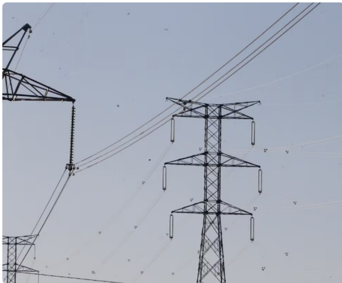
Interconexión eléctrica.

El otro tema complejo que será de obligatorio abordaje en la junta será el de la demanda contra la elección de los cinco integrantes que están en el equipo , como miembros patrimoniales, es decir, amparados por el dueño mayoritario, que es Ecopetrol .