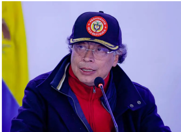
Consejo de ministros en Ipiales donde el presidente Petro anunció cambios en contratos de Ecopetrol.

El jefe de Estado anunció que contratos por $20 billones en Ecopetrol no se prorrogarán, mientras crece la incertidumbre por la salida temporal de su presidente y se pone en vilo el gobierno corporativo.