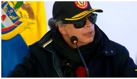
La salida temporal de Ricardo Roa genera incertidumbre en la dirección de Ecopetrol.

Aunque la imputación no implica una condena, sí lo vincula formalmente al proceso penal, lo que motivó su salida temporal del cargo para concentrarse en su defensa.