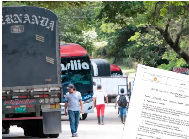
Tras seis días se levanta el paro en el departamento de Santander, Colombia, tras polémica por avalúo catastral.

Tras una mesa de diálogo, en Santander se levantó el paro al acordar la revisión técnica de avalúos catastrales con incrementos desproporcionados.