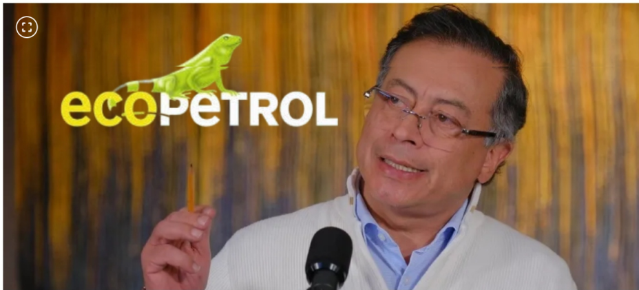
Presidente Gustavo Petro anuncia fin del 'monopolio privado' en la importación de gas natural y da entrada de Ecopetrol al mercado