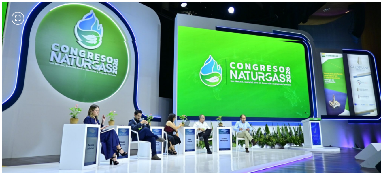
Congreso Naturgás 2026

En el marco del Congreso Naturgás 2026, varios congresistas trazaron las prioridades para el sector de cara a los próximos años.