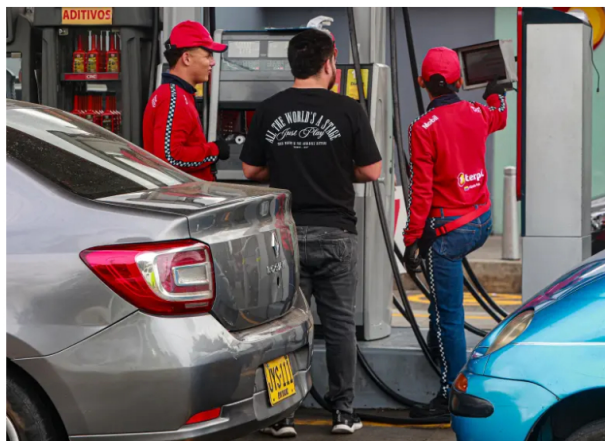
El crecimiento en las ventas de gasolina y ACPM en el primer trimestre de 2026 refleja la reactivación de la movilidad en Colombia. EYTA Manual Sabarriana

El mercado de combustibles líquidos en Colombia mostró señales de recuperación durante el primer trimestre de 2026, con incrementos en las ventas de gasolina corriente y ACPM, impulsados por la reactivación de la movilidad, el transporte de carga y la actividad productiva.