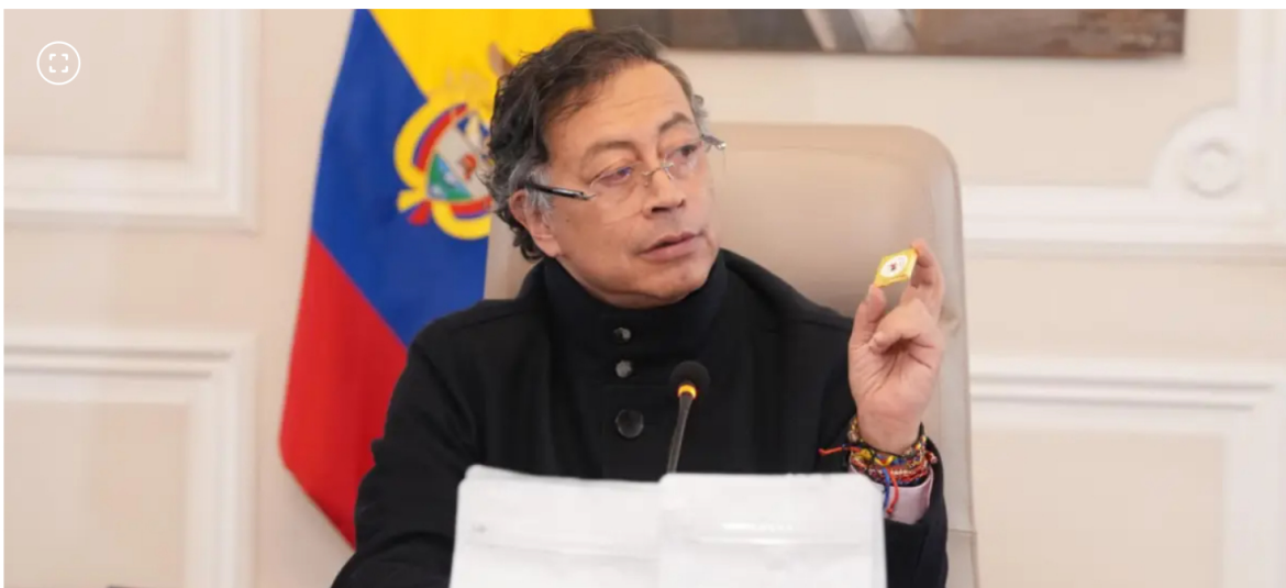
Presidente Gustavo Petro

El mandatario instó a miembros de la junta de la petrolera a nombrar cuanto antes nuevo presidente en ISA.