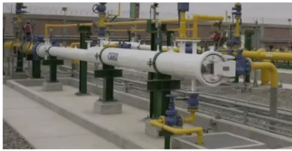
Gas natural

Sobre este tema, este jueves el presidente encargado de Ecopetrol, Juan Carlos Hurtado, profundizará detalles durante una rueda de prensa que se realizará en el marco del congreso de Naturgas.