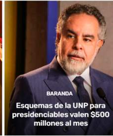
BARANDA Esquemas de la UNP para presidenciables valen $500 millones al mes