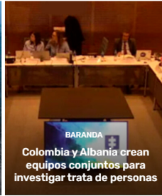
BARANDA Colombia y Albania crean equipos conjuntos para investigar trata de personas