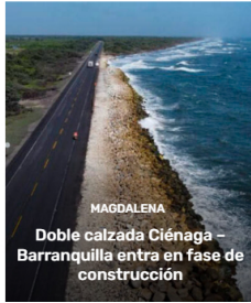
MAGDALENA Doble calzada Ciénaga – Barranquilla entra en fase de construcción