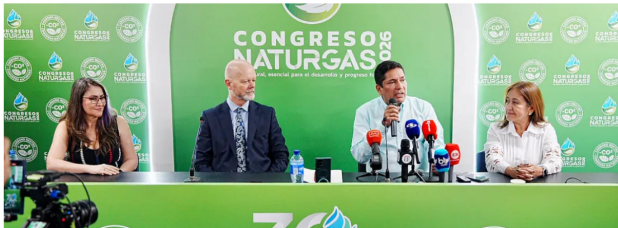
Foto: Ecopetrol y Petrobras tendrán para 2030 el primer gas del Pozo Sirius