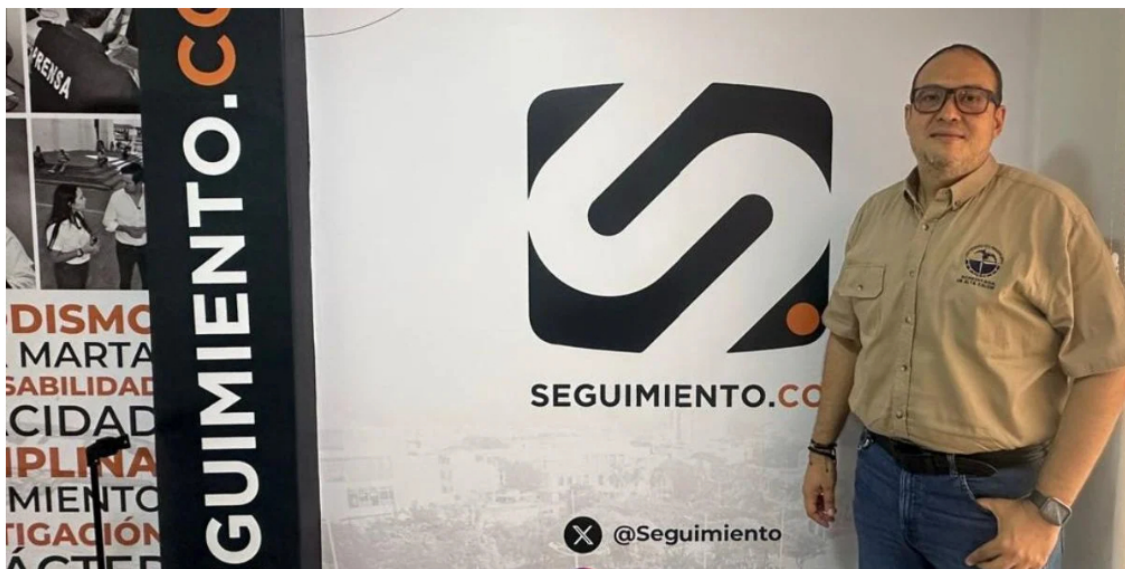
ROBERTO AGUAS / SEGUIMIENTO.CO