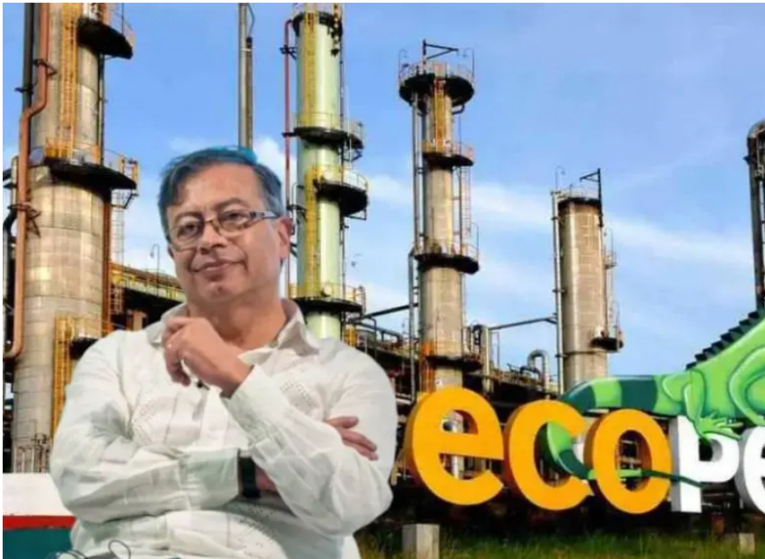
El Gobierno de Gustavo Petro envió al Congreso de la República el Plan Indicativo de Enajenación Global para la vigencia 2026.

El Gobierno Nacional presentó al Congreso un documento que identifica activos de Ecopetrol por $50 billones como susceptibles de una eventual y futura desinversión.