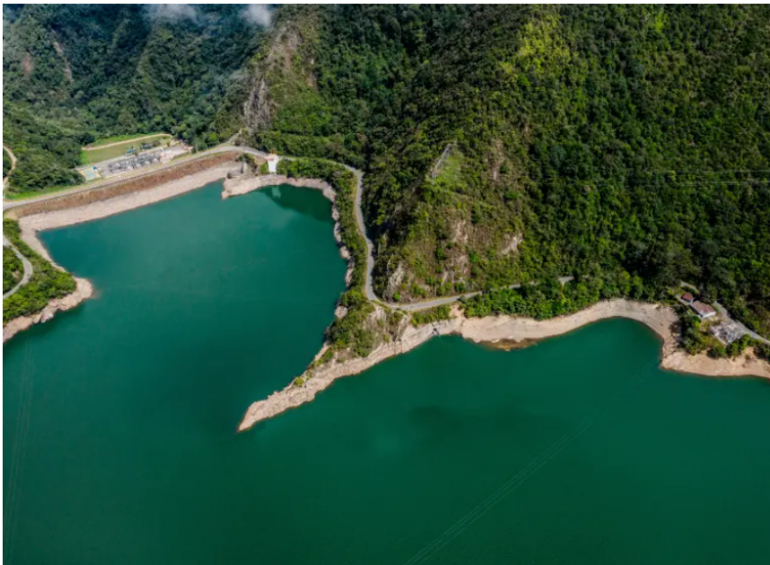
Celsia ejecutó una recompra de acciones por cerca de $150.000 millones, con participación del 89,5% de sus accionistas.

La empresa energética cerró su programa extraordinario de recompra con alta participación accionaria y anunció nuevos pagos de dividendos para 2025 y 2027.