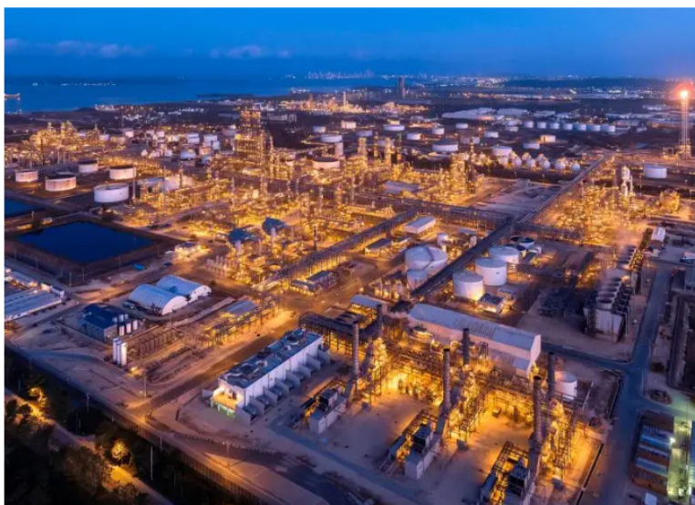
Refinería de Cartagena.

Además, el Ministerio de Hacienda aclara que una decisión específica de enajenación solo puede adoptarse “a través de un programa de enajenación contenido en un decreto expedido por el Gobierno Nacional” , tras un proceso de debida diligencia.