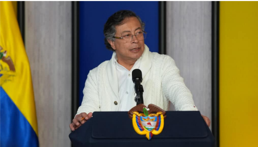
Presidente Gustavo Petro.