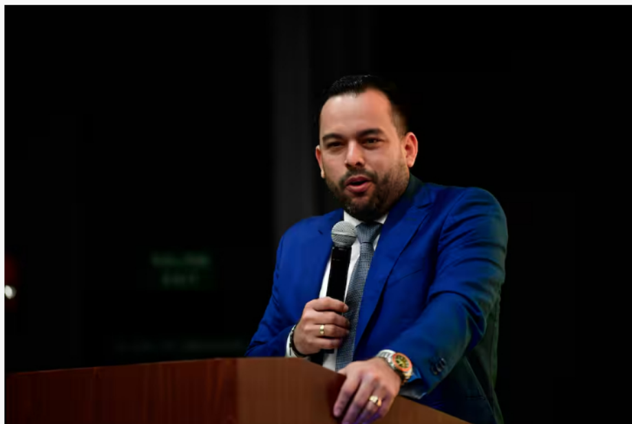
Edwin Palma, ministro de Minas y Energía.