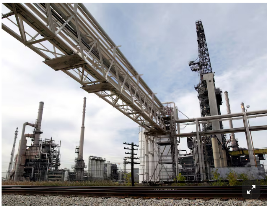
El precio registra ganancia semanal. Aquí los precios del barril de petróleo Brent y el West Texas Intermediate (WTI) de hoy, 8 de julio.

“La reconstruiremos de forma muy rentable (...) Vamos a utilizar petróleo y vamos a sacar petróleo. Vamos a bajar los precios del petróleo y vamos a dar dinero a Venezuela , que lo necesita desesperadamente”, señaló el Presidente Trump en una de las declaraciones que ofreció luego del operativo militar en Venezuela.