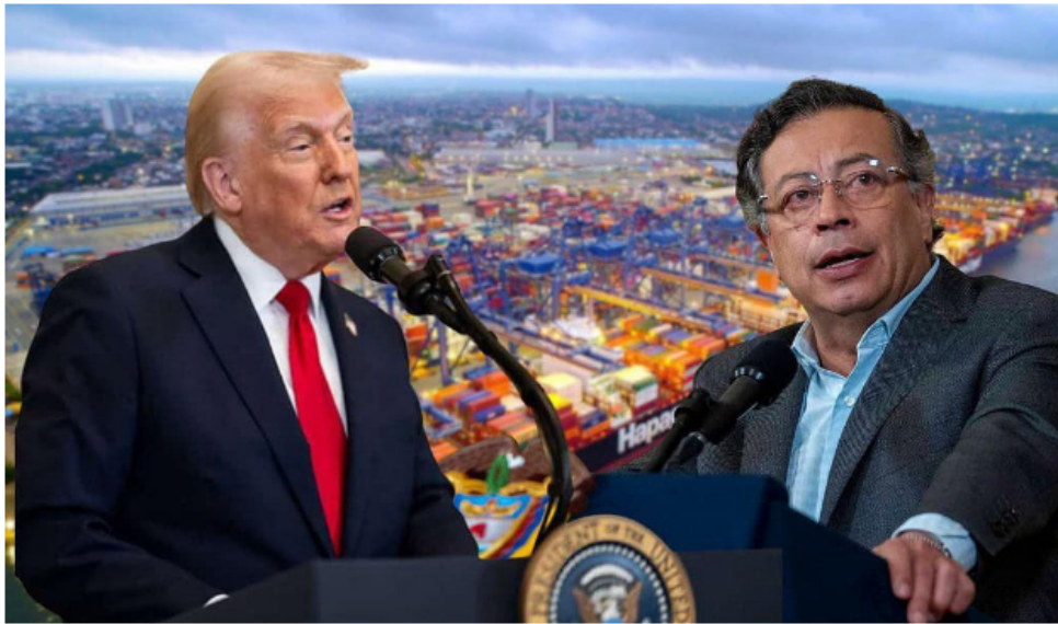
Donald Trump, presidente de EE. UU., y Gustavo Petro, presidente de Colombia.

dólares necesarias para reconstruir una infraestructura conjunta que permita importar gas desde Venezuela hacia Colombia. Bernal también añadió que las estimaciones sobre los recursos que necesita Venezuela para repotenciar su sector energético superan ampliamente los US$100.000 millones anunciados por Trump.