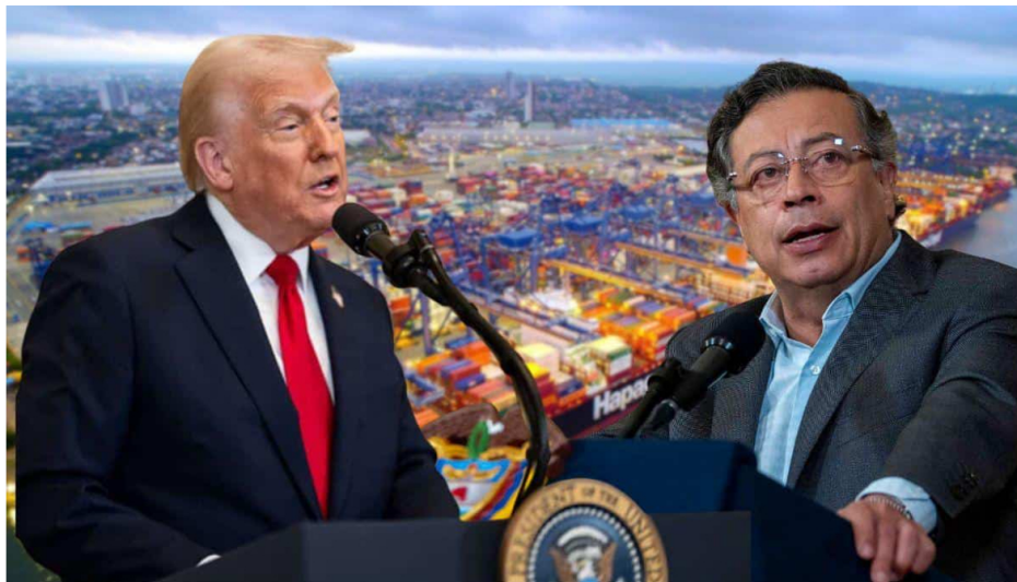
Donald Trump, presidente de EE. UU., y Gustavo Petro, presidente de Colombia.

Sin embargo, estos son apenas indicios de lo que podría suceder en el futuro. No existe claridad sobre de dónde saldrían las decenas de millones de dólares necesarias para reconstruir una infraestructura conjunta que permita importar gas desde Venezuela hacia Colombia. Bernal también añadió que las estimaciones sobre los recursos que necesita Venezuela para repotenciar su sector energético superan ampliamente los US$100.000 millones anunciados por Trump.