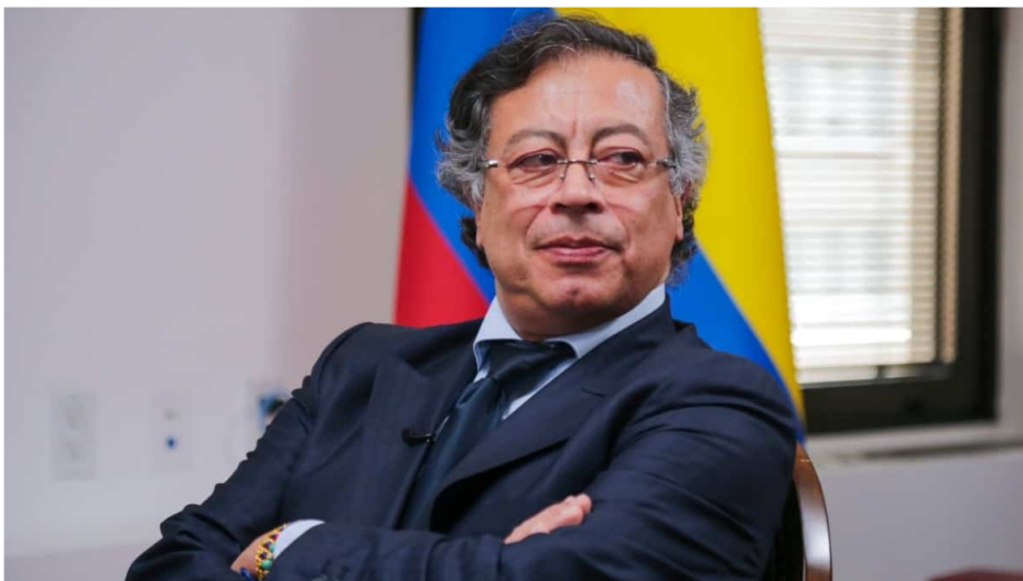
Gustavo Petro, presidente de Colombia.

Por: Manuel Alejandro Correa - 2026-01-13