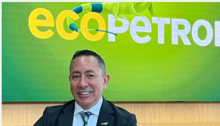
El presidente de Ecopetrol, Ricardo Roa.