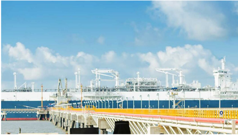
Ecopetrol y Frontera Energy firman acuerdo estratégico para la contratación.

Bogotá, 2 de febrero de 2026. El Grupo Ecopetrol y la compañía Frontera Energy, firmaron un acuerdo estratégico para la contratación de servicios de regasificación, que garantizará el suministro oportuno y confiable de gas natural en Colombia a partir del tercer trimestre de 2026.