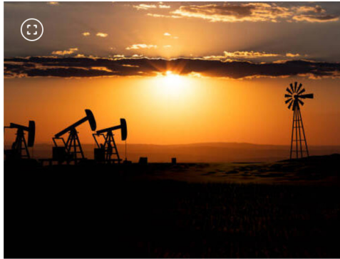
Trump insistió en que Colombia puede jugar un papel clave en la reactivación de partes de Venezuela.

"El presidente Trump preguntó por qué no se había avanzado antes, y la respuesta fue clara: las sanciones que ustedes han puesto sobre Venezuela no permiten que nosotros hagamos negocios allí", relató García-Peña, en alusión a los bloqueos económicos que limitan la cooperación binacional.