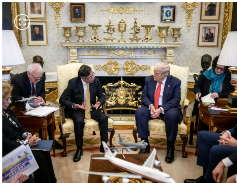
Encuentro Trump y Petro el martes en la Casa Blanca.

El papel que Colombia podría desempeñar en la reconstrucción de Venezuela fue uno de los temas centrales de la reunión que los presidentes Gustavo Petro y Donald Trump sostuvieron este martes en la Casa Blanca, según explicó el embajador de Colombia en Estados Unidos, Daniel García-Peña, en una entrevista con EL TIEMPO.