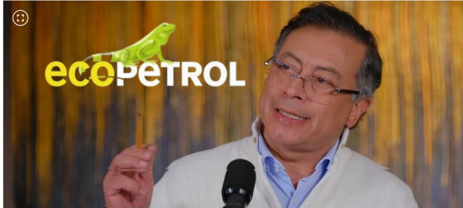
Colombia promueve que Ecopetrol pueda liderar iniciativas de recuperación eléctrica y energética en el occidente venezolano.

El embajador García-Peña explicó a EL TIEMPO el interés de la administración Trump por conocer el papel de Colombia en relación con Venezuela.