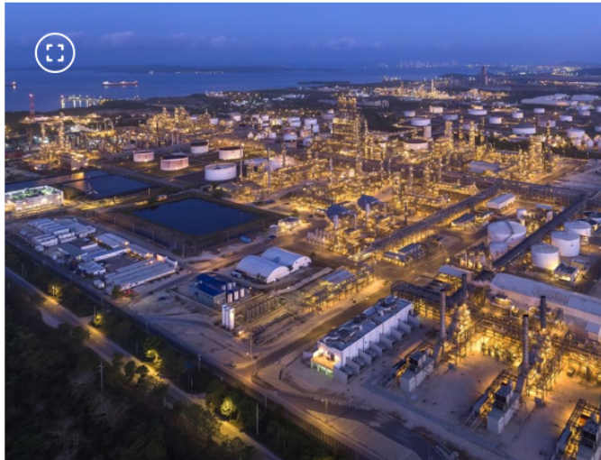
Refinería de Cartagena (Reficar)

El otro punto, el de la planta de hidrógeno verde más grande de América Latina, tiene un diagnóstico similar.