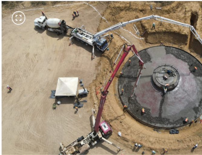
Parque eólico Windpeshi

Sin embargo, expertos y hasta miembros del propio Gobierno aseguran que encontraron imprecisiones en al menos tres asuntos de fondo que no se podrían ejecutar como se dijo en la rueda de prensa.