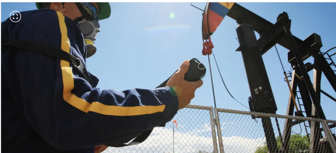
La acción de Ecopetrol se cotiza sobre los $2.200 en la primera parte de febrero.

Según la Bolsa de Valores de Colombia durante la jornada de este martes presentó una desvalorización de 1,78%.