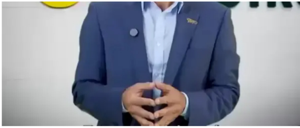
Ricardo Roa, presidente de Ecopetrol es investigado por la Fiscalía