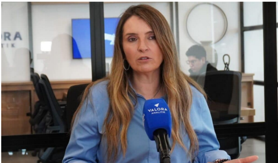
Paloma Valencia, candidata presidencial.

“ Paloma Valencia ha sido clara en que buscaría revertir buena parte de las decisiones adoptadas durante el gobierno Petro. Su apuesta pasa por recuperar la exploración de petróleo y gas, otorgar nuevas áreas para exploración, acelerar licencias y destrabar proyectos, además de restablecer la confianza de los inversionistas”, expresó Iván Arroyave , experto del sector y banquero de inversión.