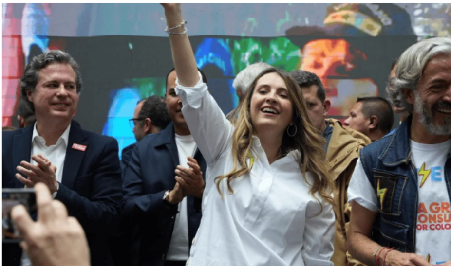
Paloma Valencia, candidata presidencial.

Sin embargo, manifestó que el riesgo de conflictividad social en un eventual gobierno de Valencia sería medio, en comparación con un eventual gobierno de Iván Cepeda , que se ubicaría en estándares entre medios y bajos. Aunque también dijo que las inversiones relacionadas con transición energética y asuntos medioambientales podrían mantenerse en un rango entre medio y alto.