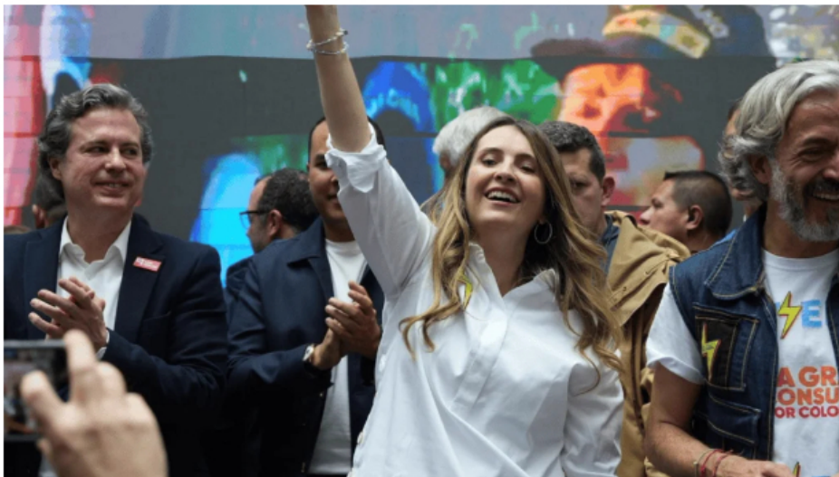
Paloma Valencia, candidata presidencial.