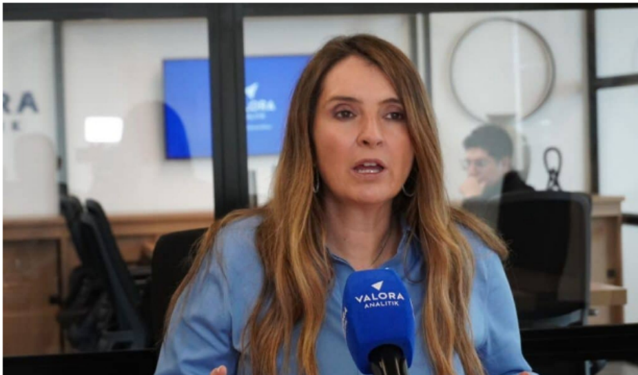
Paloma Valencia, candidata presidencial.

Si se pone la lupa sobre temas como la reactivación de la industria petrolera y gasífera, las inversiones en exploración y el papel de Ecopetrol , en un eventual gobierno de Valencia habría un viraje en la política energética colombiana.