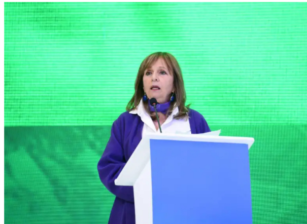
Ángela María Robledo, presidenta de la junta directiva de Ecopetrol.

La presidenta de la junta directiva aseguró que se activó un protocolo interno para darle seguimiento a las investigaciones contra Ricardo Roa. También defendió la presunción de inocencia del directivo.