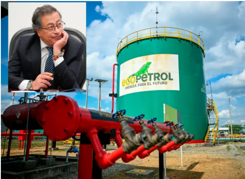
El freno al Proyecto Oslo reavivó el debate sobre decisiones económicas basadas en criterios políticos y técnicos.

Un análisis estima que la decisión de frenar inversión de US$3.600 millones generó una pérdida potencial de hasta US$8.400 millones.