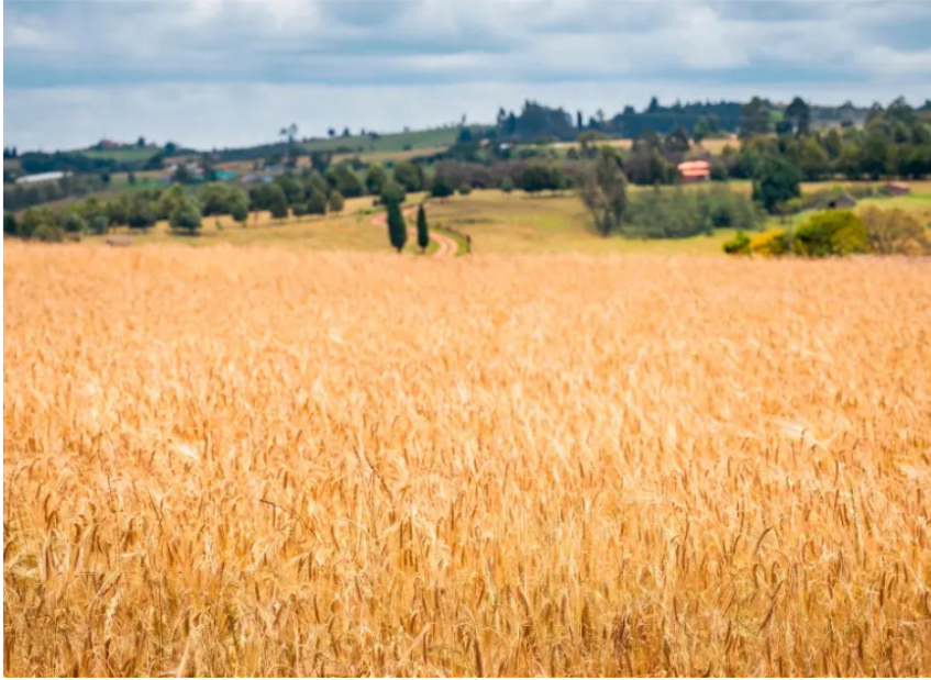
Fenalce pidió al Ministerio de Agricultura ajustar la asignación del Incentivo al Seguro Agropecuario para evitar el agotamiento anticipado de recursos en 2026.

Agropecuario no contempla los calendarios de siembra por cultivo y región, lo que estaría dejando sin cobertura a productores del segundo semestre de 2026.