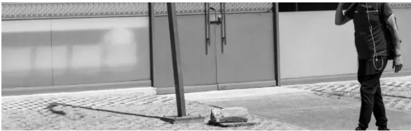
El hueco real de Colpensiones lo causó el alza del 23% al salario mínimo.