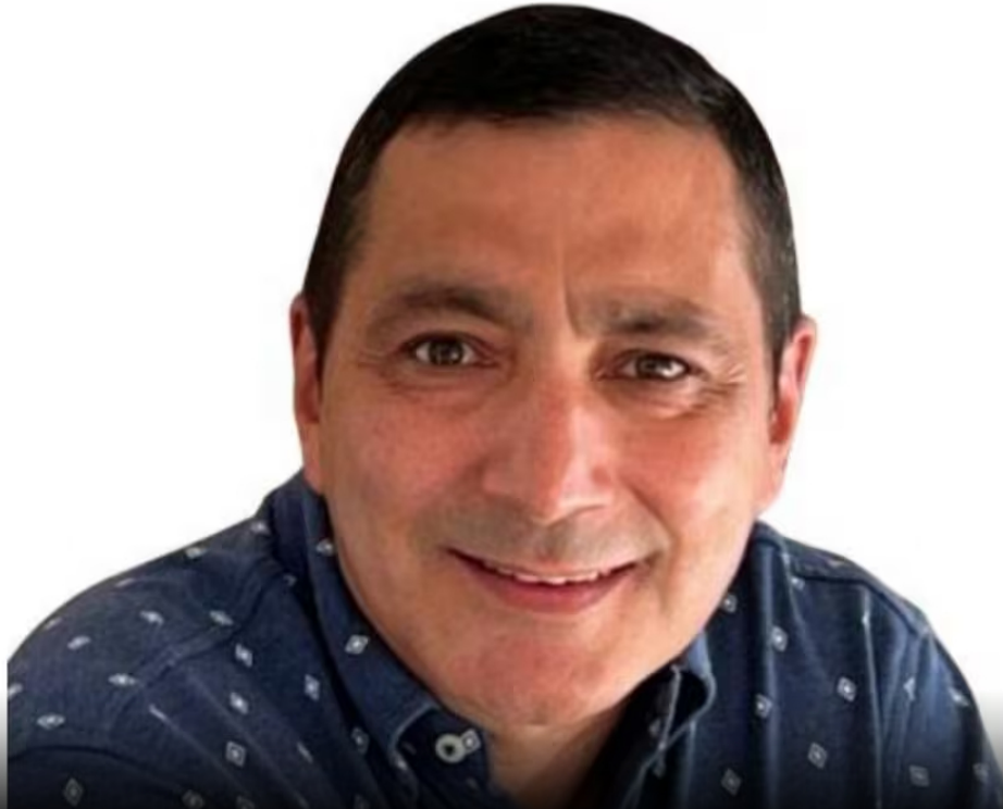
Cortesía Juan Gonzalo Castaño.