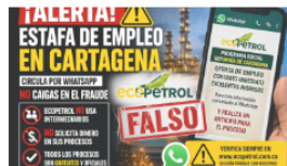
Ecopetrol lanza alerta urgente por estafa laboral en Cartagena que circula por WhatsApp 24 abril, 2026 En «Cartagena»