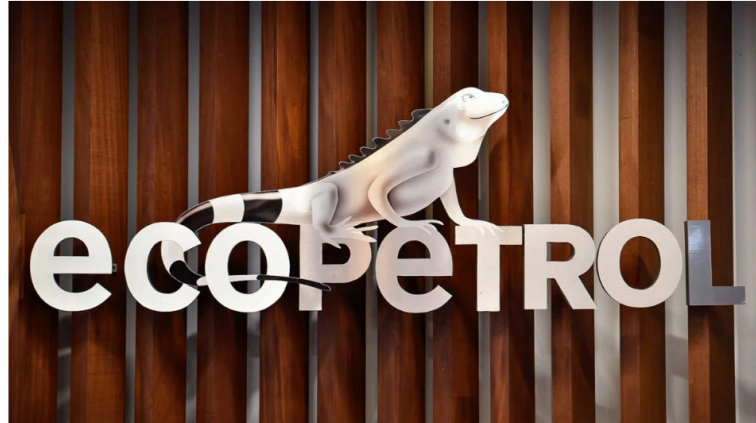
Empresa Colombiana de Petróleos (Ecopetrol).

La Asociación Sindical de Trabajadores del Sector Petrolero (ASOPETROL) expresó preocupación por los resultados financieros de Ecopetrol correspondientes al primer trimestre de 2026 y advirtió que la alta carga tributaria sobre la compañía podría generar una migración de talento humano, bienes y servicios hacia el sector petrolero venezolano.