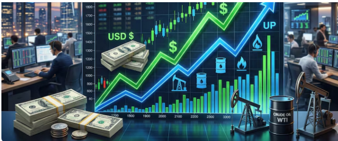
El petróleo no suelta la tendencia al alza.

El comportamiento del precio del crudo tiene efectos tanto de corto como de largo plazo para el país que, pese a la transición energética impulsada para frenar la exploración petrolera mediante nuevos contratos, sigue derivando gran parte de sus ingresos de los hidrocarburos.