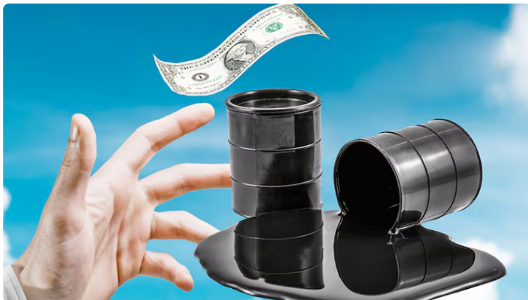
Precio del petróleo este lunes 18 de mayo.

Tres drones que habrían ingresado por la frontera occidental de Emiratos Árabes y provocado un incendio en cercanías de una central nuclear están afectando fuertemente el precio del petróleo, uno de los principales commodities de Colombia.