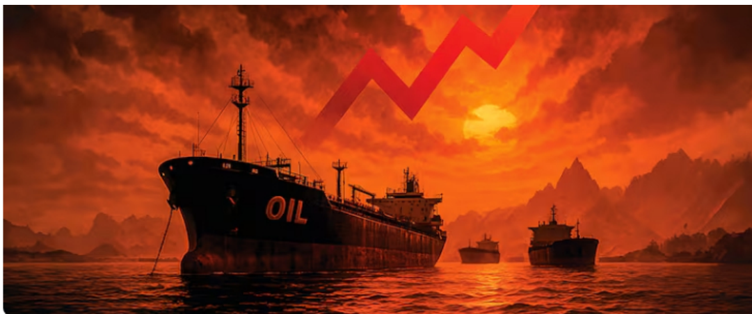
Materias primas se encarecen por conflicto en Oriente Medio.

Lo cierto es que, en la jornada de este 18 de mayo, el impacto en los mercados por lo sucedido en Oriente Medio no pasó desapercibido. Según la agencia de noticias AFP, la Bolsa de Nueva York abrió con leves alzas este lunes, en el inicio de una semana en la que los inversionistas observan los rendimientos de los bonos y los precios del petróleo ante la incertidumbre por el estancamiento diplomático entre Washington y Teherán.