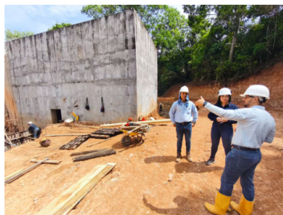
Los trabajos en la Planta de Lodos se reactivaron luego de que Ecopetrol, la Alcaldía y Aguas de Barrancabermeja lograran asegurar recursos adicionales por $11 millones.

La obra se desarrolla mediante un convenio entre Ecopetrol, Aguas de Barrancabermeja y el Distrito.