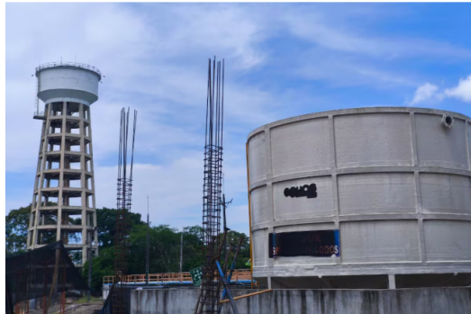
Los trabajos en la Planta de Lodos se reactivaron luego de que Ecopetrol, la Alcaldía y Aguas de Barrancabermeja lograran asegurar recursos adicionales por $11 millones.