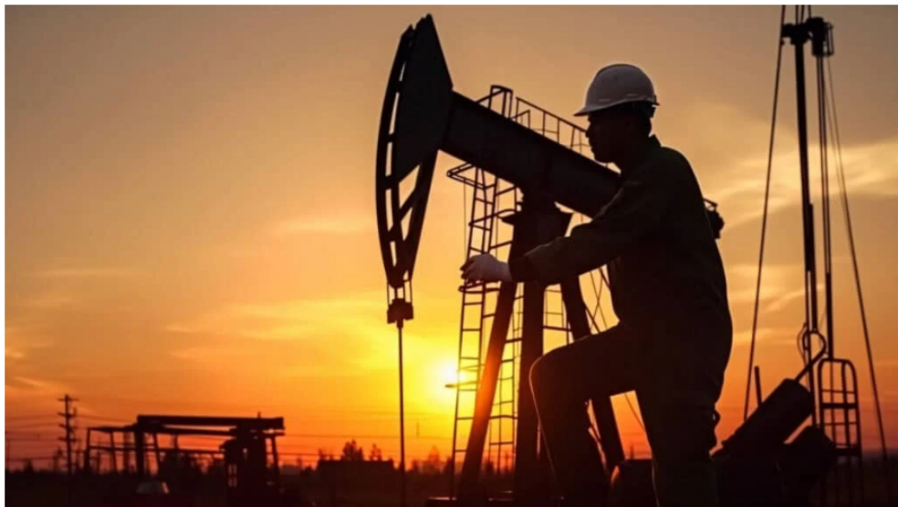
Sector de y gasífero.

Por: Manuel Alejandro Correa - 2026-05-21