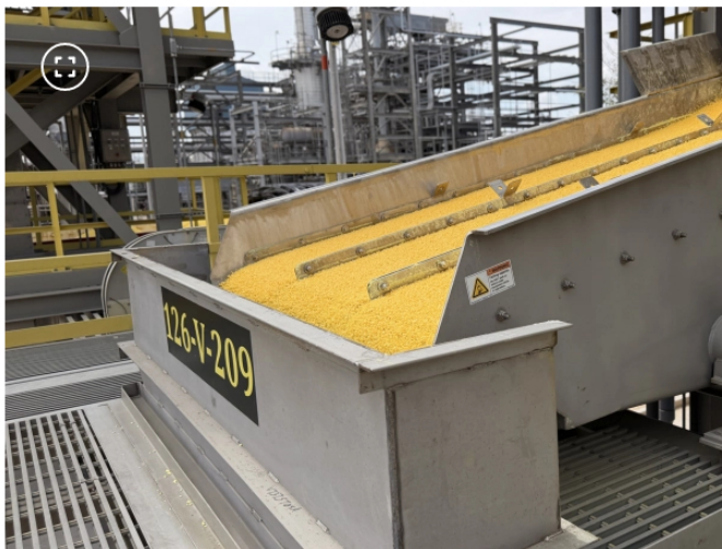
Exportaciones de azufre de Ecopetrol

Además de ampliar la capacidad comercial , el proyecto también busca darle mayor flexibilidad a la disposición del azufre generado durante la refinación.