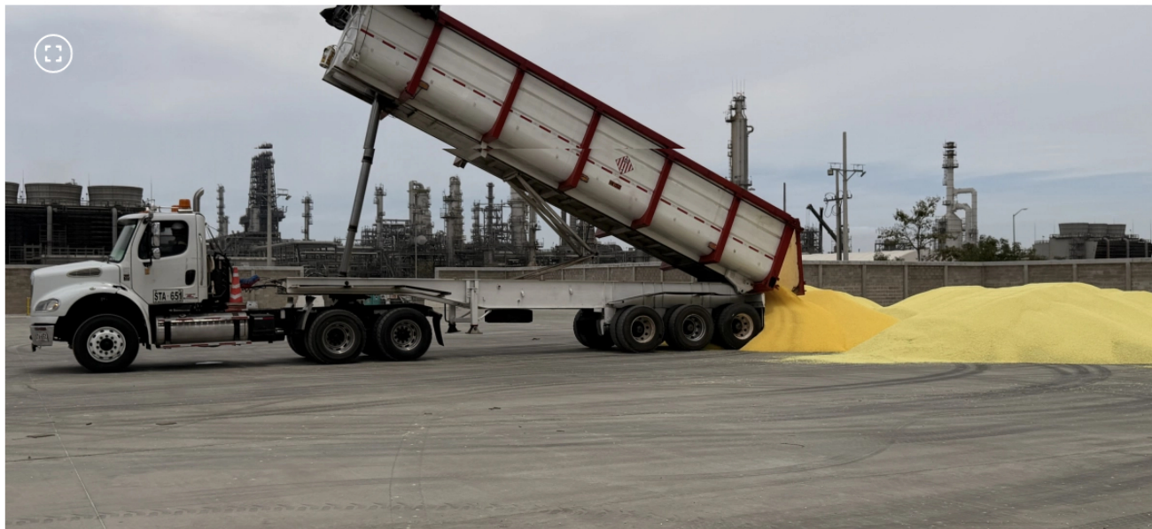
Exportaciones de azufre de Ecopetrol

La Refinería de Cartagena vendió las primeras 260 toneladas de azufre sólido producidas en su nueva planta inaugurada en abril.