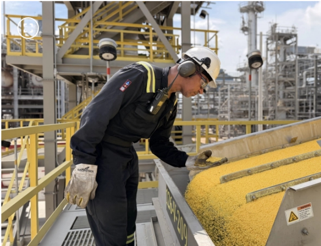
Exportaciones de azufre de Ecopetrol

Con esta operación, la Refinería de Cartagena busca ampliar su presencia en el mercado petroquímico y aumentar la capacidad de aprovechamiento de subproductos derivados de la refinación de combustibles.