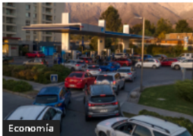
Economía Cuellos de botella afectan economía global y precios combustibles