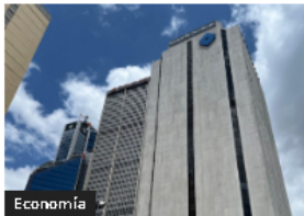
Economía Sistema Financiero: Ganancias Modestas, Crédito en Auge 2026