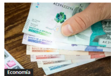
Economía Fallo Corte Suprema: Subsidio de transporte y ruta empresa