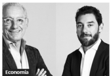
Economía Mango: El Imperio de moda y el giro judicial de su heredero