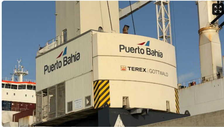
Puerto Bahía