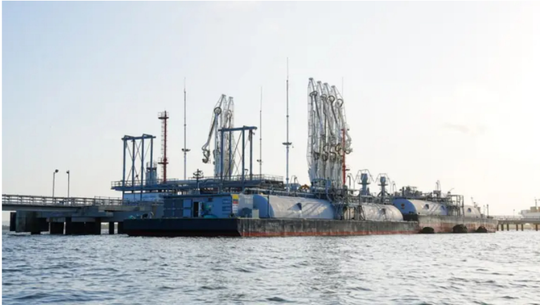
Ecopetrol y Puerto Bahía

Se espera que el proyecto ayude a reducir el riesgo de escasez de este combustible en Colombia, especialmente ante la llegada del fenómeno de El Niño y el aumento en la demanda energética del país.