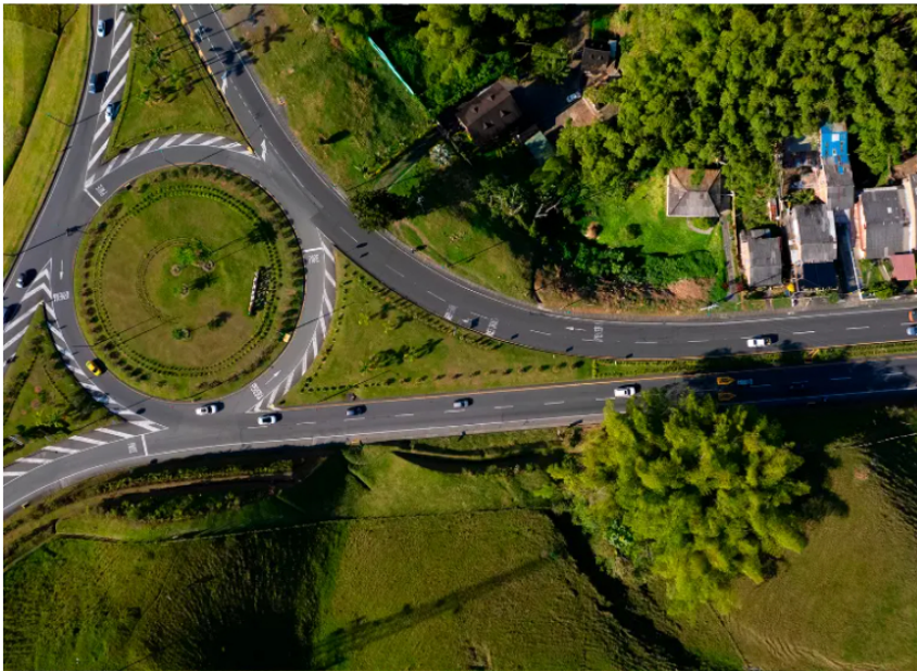
Odinsa aseguró que la concesión Autopistas del Café terminará en 2027 y defendió el modelo de peajes para financiar obras.