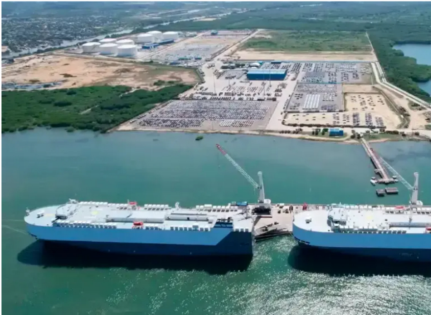
El proyecto se desarrollará utilizando la infraestructura marítima ya existente y operativa del terminal portuario de Cartagena, donde se recibirá e internará Gas Natural Licuado (GNL).

Las compañías obtuvieron todos los permisos regulatorios y ambientales para iniciar la ejecución de un proyecto que aportará hasta 300 GBTUD de gas natural desde diciembre de 2026.