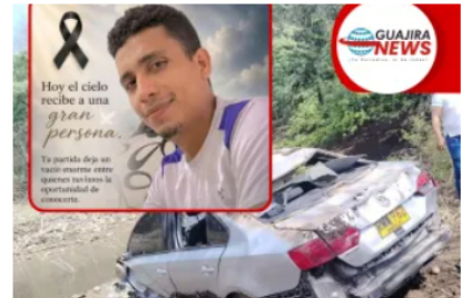
Murió trabajador de Cerrejón tras permanecer varios días hospitalizado por accidente entre Hatonuevo y Papayal 25 mayo, 2026