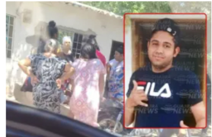
Atentado sicarial en Barrancas deja a un hombre gravemente herido; fue remitido a San Juan del Cesar 25 mayo, 2026