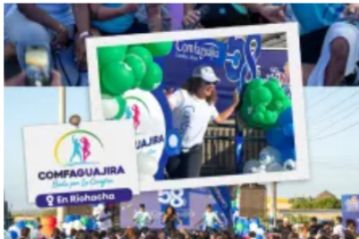
Más de 15 municipios vivieron simultáneamente la gran Rumba Terapia de Comfaguajira 25 mayo, 2026