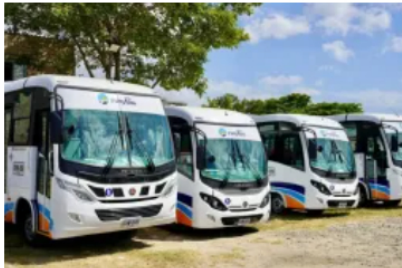
Después de 2 décadas... 25 mayo, 2026