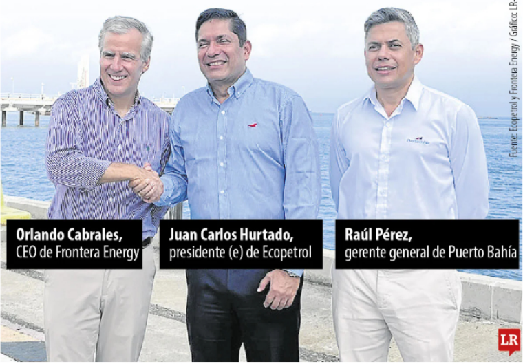
Ecopetrol / Frontera Energy

La aprobación de los permisos de parte de la ANI y la An/a permite a Puerto Bahía avanzar en los procesos de contratación de servicios logísticos, cierre contractual de la unidad flotante de almacenamiento y regasificación (Fsru), compras, construcción e integración de infraestructura para garantizar la entrada en operación en diciembre de 2026.