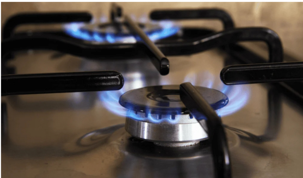
Gas natural.

Adicionalmente, revisará la concentración del mercado, en donde Ecopetrol tiene 63,15 % de la producción, Hocol (14,66 %) y Canacol Energy (5,79 %), con el objetivo de evaluar su impacto sobre los precios en el mercado mayorista. A esto se suma la vigilancia sobre la operación y los márgenes financieros de los comercializadores en el mercado secundario, con el fin de identificar posibles prácticas que terminen afectando a los usuarios a través de mayores tarifas.