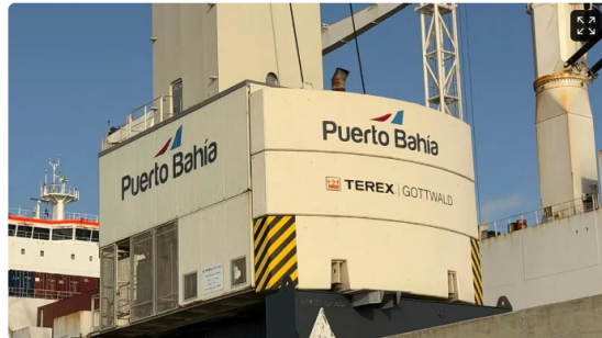
Puerto Bahía