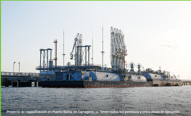
Proyecto de regasificación en Puerto Bahía, en Cartagena, ya tienen todos los permisos y entra etapa de ejecución

Home / 2026 / mayo / 26 / Cartagena y Puerto Bahía logran permisos, Ecopetrol asegura ejecución definitiva del proyecto de regasificación