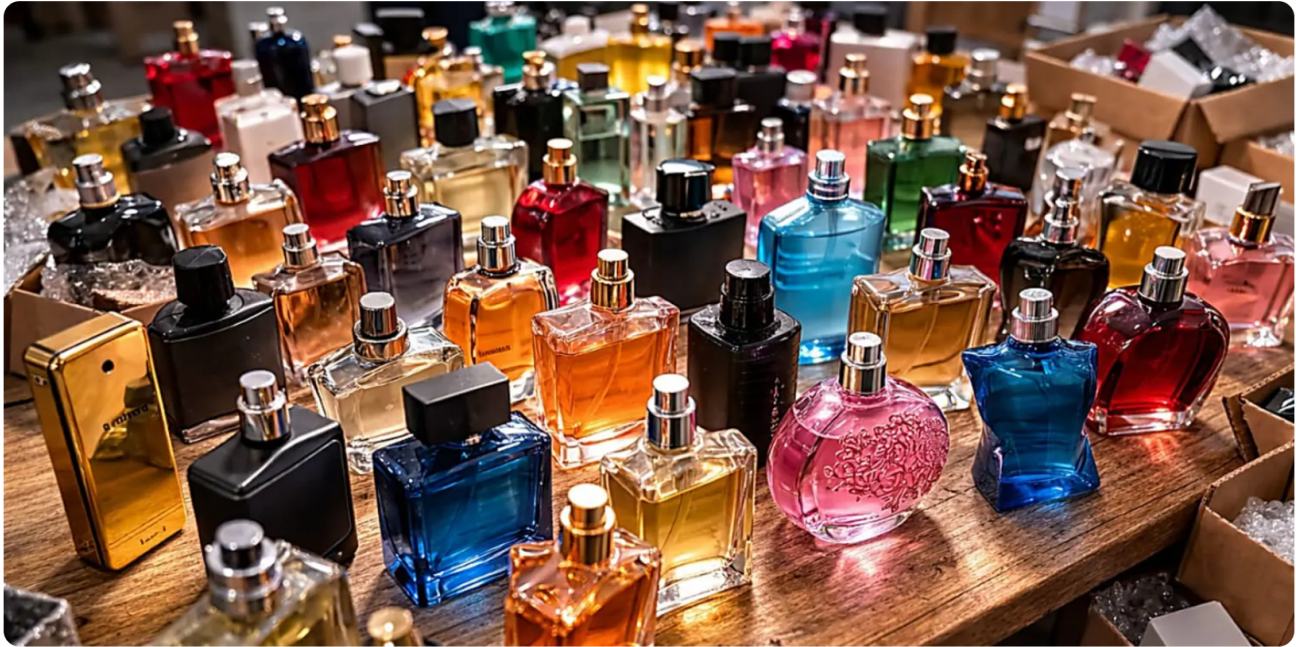
Kit de perfumes importados disponible en proceso de liquidación Perfumes importados | Patrocinado