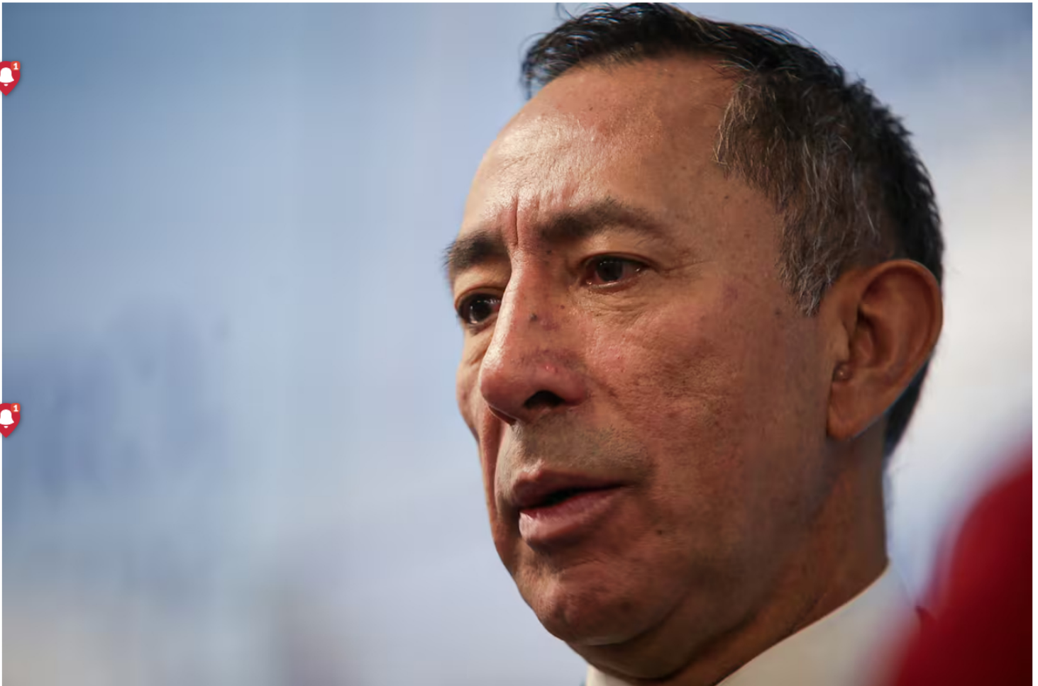
El presidente de Ecopetrol , Ricardo Roa Barragán.

Redacción Colombia 27 MAY 2026 - 09:52 PM