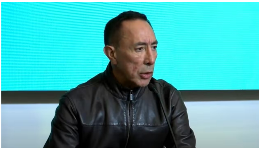
Ricardo Roa Barragán, presidente de Ecopetrol, se encuentra en un periodo de vacaciones y de licencia.

Siga a EL PAÍS en Google Discover y no se pierda las últimas noticias