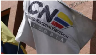
CNE precisa su rol en actos de campaña electoral