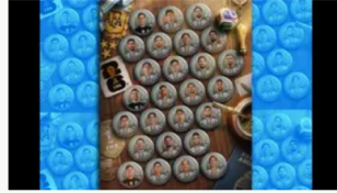
Argentina confirmó convocatoria para el Mundial 2026 con Messi a la cabeza