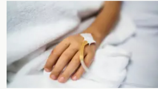
Suspenden servicios de anestesiología en hospital de Caldas, Antioquia, por deuda de $1.300 millones