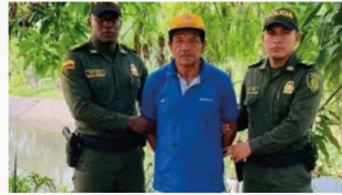
Adulto mayor mató a un hombre en Cali tras presunto caso de maltrato animal contra su perro