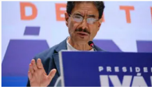
Iván Cepeda anuncia sistema anticorrupción liderado por Iván Velásquez si llega a la Presidencia