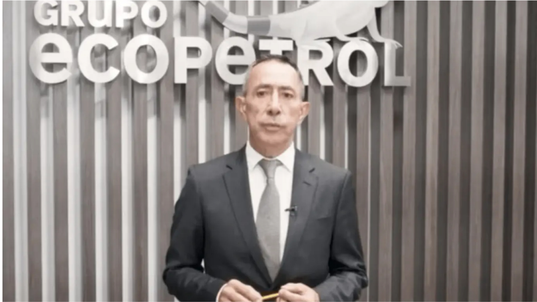
Créditos: Ricardo Roa, presidente de Ecopetrol.

La Junta Directiva de Ecopetrol confirmó que Ricardo Roa continuará fuera de la presidencia de la compañía tras recibir una incapacidad médica.