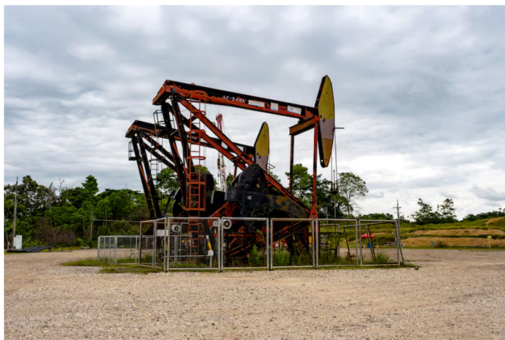
Exploración petrolera: el impacto económico de limitar nuevos contratos. Pozos de extracción de petróleo en los yacimientos de Ecopetrol en Barrancabermeja, departamento de Santander, Colombia, el miércoles 9 de octubre de 2025.

Expertos señalan que la transición energética es inevitable, pero insisten en que debe hacerse de forma gradual y financiada.