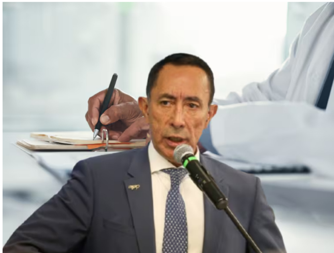
Imagen de referencia. Ricardo Roa: Colprensa / Firma de médico: Getty Images.

El directivo reportó la incapacidad médica el pasado 26 de mayo. Debido a esto, a partir del 27 de junio, iniciará su licencia no remunerada por 30 días calendario, extendiendo su tiempo fuera de la empresa petrolera hasta el 27 de julio.