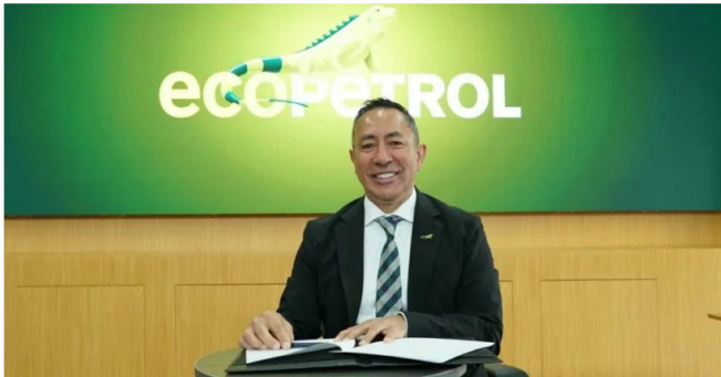
Presidente de Ecopetrol, Ricardo Roa.

El presidente de Ecopetrol, Ricardo Roa, permanecerá fuera del cargo hasta finales de julio, luego de encadenar una incapacidad médica de 30 días con vacaciones pendientes y una licencia no remunerada previamente solicitada.