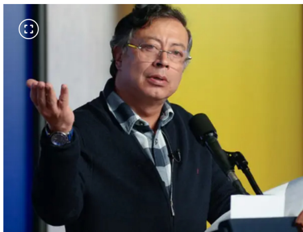
Presidente Gustavo Petro