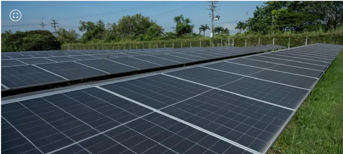
Parques solares de Zelestra, la nueva adquisición de Promigás.

Promigas completó la adquisición total de Zelestra Latam, empresa dedicada a la generación de energías renovables.